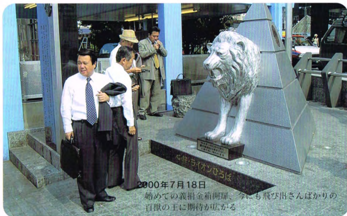
2000年7月18日 初めての義捐金箱開扉、今にも飛び出さんばかりの百獣の王に期待が広がる