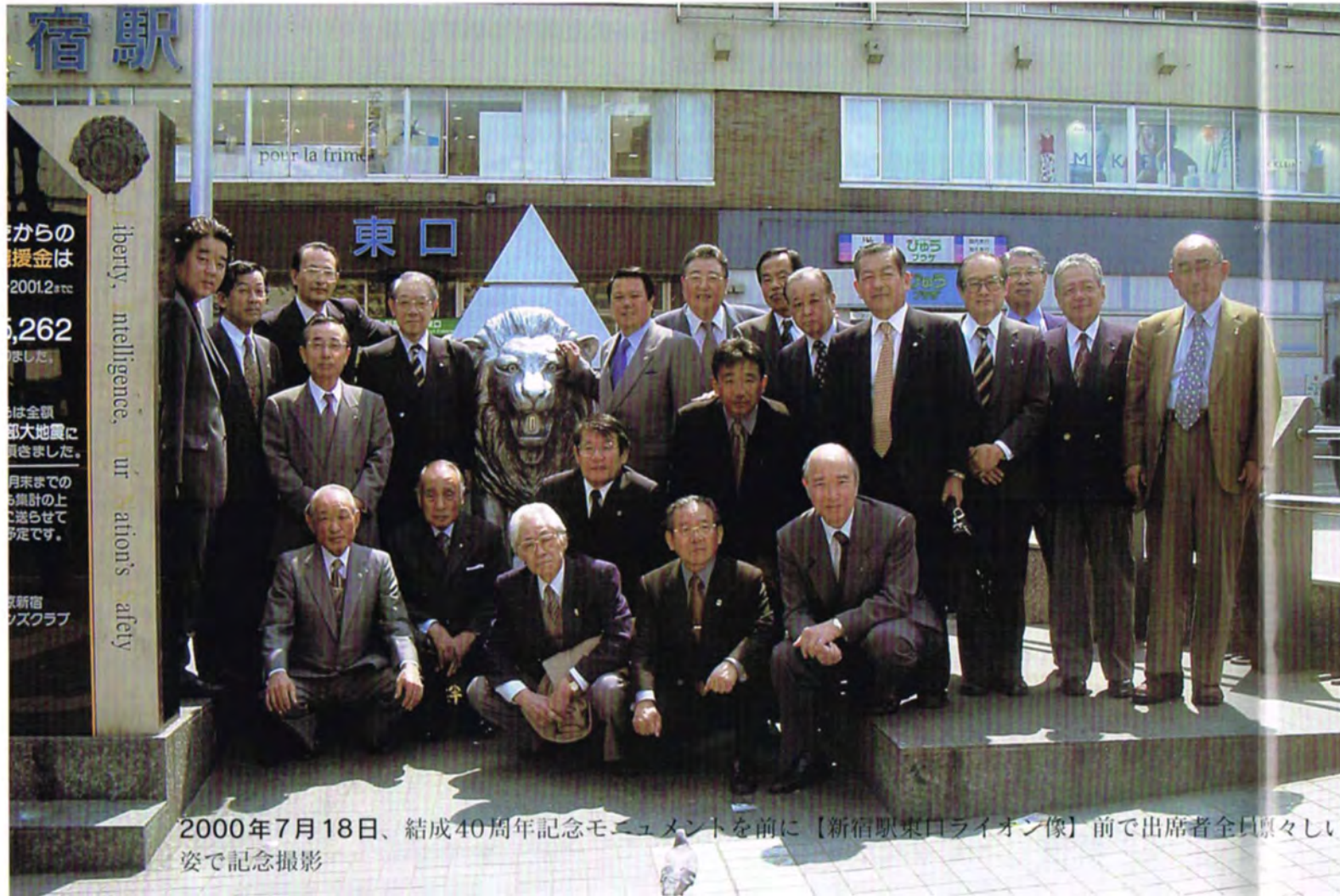
2000年7月18日、結成40周年記念モニュメントを前に【新宿駅東口ライオン像】前で出席者全員原々しい姿で記念撮影