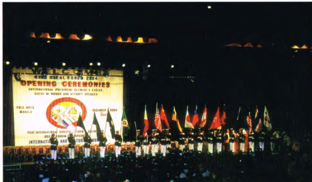
2004年12月1日～12月5日 5日間にわたって行われた第43回OSEALフォーラム IN フィリピン・マニラの場面