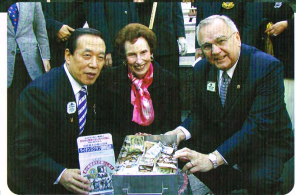
2005年2月22日 クレメント・F・クジアク国際会長が新宿駅東口ライオンひろばをご訪問されました。次の訪問先香港へ向かう前の慌ただしい時間の中での訪問でしたので、短い時間でしたが東京新宿ライオンズクラブメンバーを中心に有意義な、楽しい時間を過ごされておいででした。