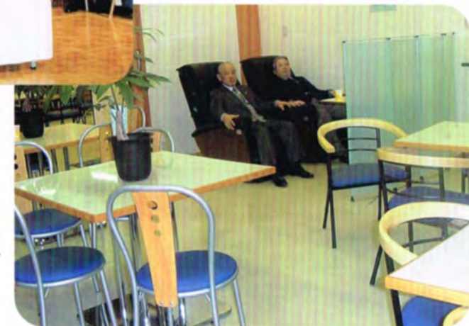
2000年11月11日 日本一の献血協力者数を誇る日本赤十字社東口血液センターにマッサージ器を寄贈。